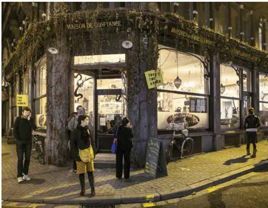
KVS - Tok Toc Knock

mijn kunstenaarschap is deze stad bepalend geweest. Brussel is een rare constructie met ook gaten, maar juist daarom openen zich soms interessante mogelijkheden.