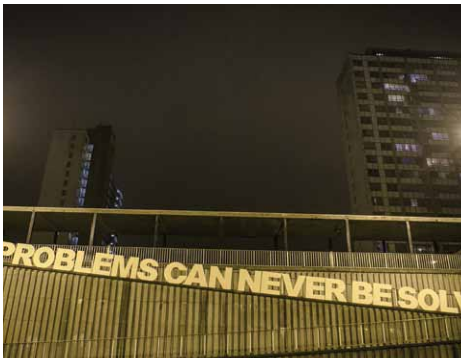
KVS - Tok Toc Knock / Jozef Wouters

uit de beslotenheid van een gemeenschap en ze delen. In Brussel zijn er vele gemeenschappen, er is dus veel werk aan de winkel! Concreet betekent dit dat we binnen de KVS ook stemmen uit andere cultuurgemeenschappen een plek geven.