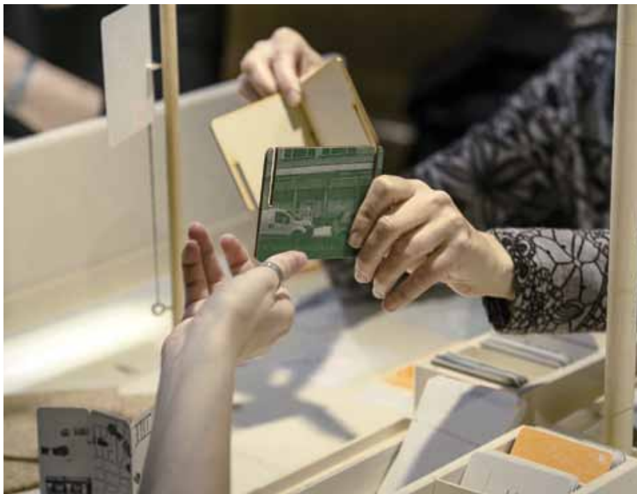
© Danny Willems: KVS - Tok Toc Knock

Tweekerkenstraat de Simon Allemeersch, racontaient l'histoire d'une rue. D'autres se concentraient sur des figures publiques telles que Guy Cudell, l'ex-bourgmestre de Saint-Josse, ou Renaat Braem, l'architecte moderniste de la Cité Modèle. Pourquoi ce choix de quartiers et de récits ?